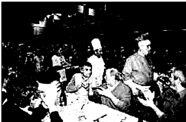
La sfilata degli chef e dei volontari tra le tavolate

I protagonisti della Grande Cena sono stati i lavoratori e i soci delle cooperative di Reggio Emilia – in particolare Coopsette, Coop Consumatori Nordest, Cormo, Cantine Riunite, Coopselios, Tecton, Legacoop, Ccpl, Unieco, Orion, Unipeg, Consorzio Quarantacinque, Telereggio - che, insieme a tanti altri reggiani, hanno affollato la serata di solidarietà.